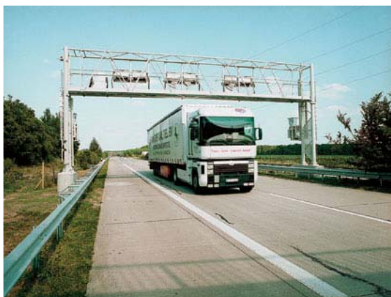
Lkw unter Kontrollbrücke

Bei stationären Kontrollen (Standkontrollen) an besonders eingerichteten Autobahnrastplätzen stehen die teilnehmenden Mautkontrollgruppen in Funk-Datenkontakt mit voraus gelagerten automatischen Kontrollbrücken. Von diesen Brücken werden den Kontrolleuren Bilder, Fahrzeug- und Nationalitätskennzeichen und bezüglich korrekter Mautentrichtung relevante Merkmale der Lastkraftfahrzeuge überspielt, in Verbindung mit Hinweisen auf Falsch- oder Nichtzahlung der Autobahnmaut oder Hinweisen auf eventuelle Manipulationen.