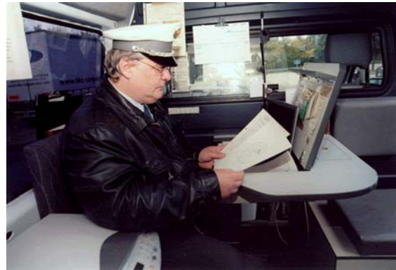
BAG-Kontrolleur im Bürofahrzeug

len steht den Kontrolleuren zum Anhalten aus dem fließenden Verkehr auch ein Anhaltesignalgeber am Kontrollfahrzeug zur Verfügung.