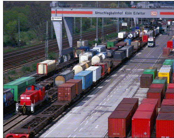
Umschlagbahnhof Köln Eifelort

Beförderungen im Inland zwischen Be- oder Entladestelle und dem nächstgelegenen geeigneten Bahnhof von der Erlaubnis- und Genehmigungspflicht befreit.