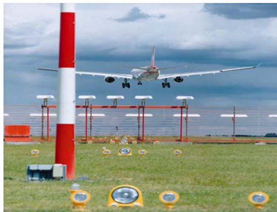
Landeanflug auf Berlin-SXF

Deutschland. Dabei steht die Analyse und Bewertung der Entwicklung der Flugpreise und -tarife, der Verkehrsnachfrage, d.h. der Passagierströme und des Verkehrs-