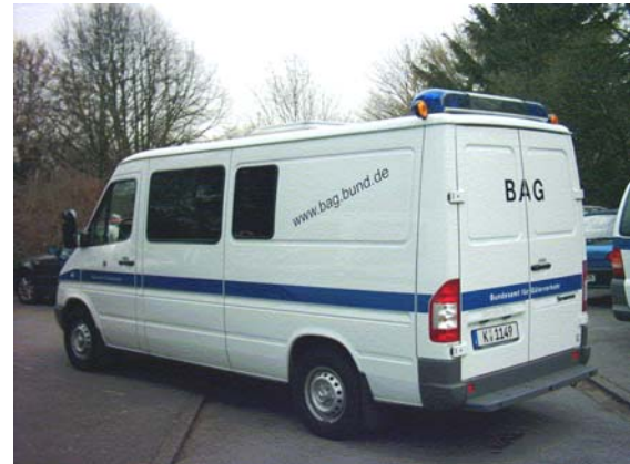
Kontrollfahrzeug des BAG

Dem Straßenkontrolldienst des Bundesamtes stehen etwa 140 besonders ausgerüstete Bürofahrzeuge zur Verfügung.