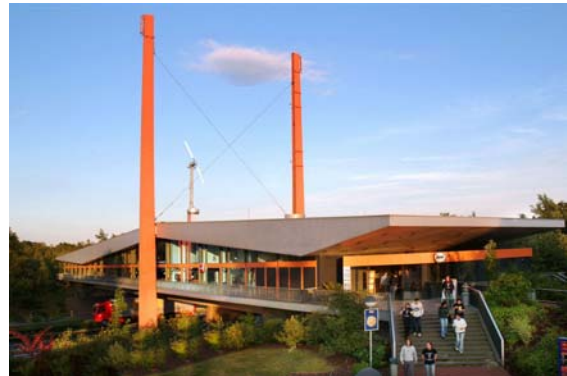
Raststätte Dammer Berge

Der Bund erzielte im Jahr 2005 Einnahmen aus der Konzessionsabgabe in Höhe von rund 15,2 Mio. Euro.